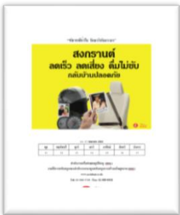
ชุดข้อมูล