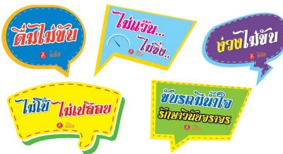
ป้ายมือถือ

2. ผลิตสื่อสนับสนุนเครือข่าย กระจายแก่ภาคีเครือข่ายทั่วประเทศ จำนวน 700 แห่ง