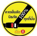
เข็มกัลด