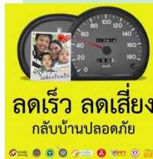
ป้ายตั้งโต๊ะ

2. ผลิตสื่อสนับสนุนเครือข่าย กระจายแก่ภาคีเครือข่ายทั่วประเทศ จำนวน 700 แห่ง