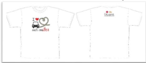
เสื้อธงรงค์